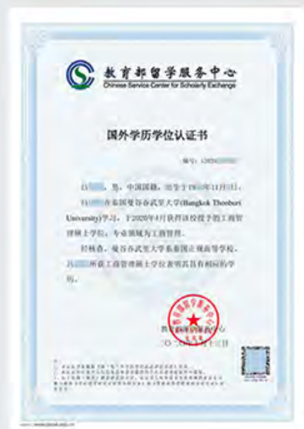
硕士学位学历认证