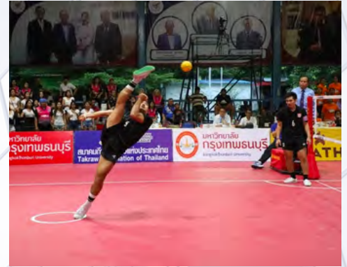
SEPAK TAKRAW HALL 藤球馆