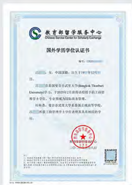
学士学位学历认证