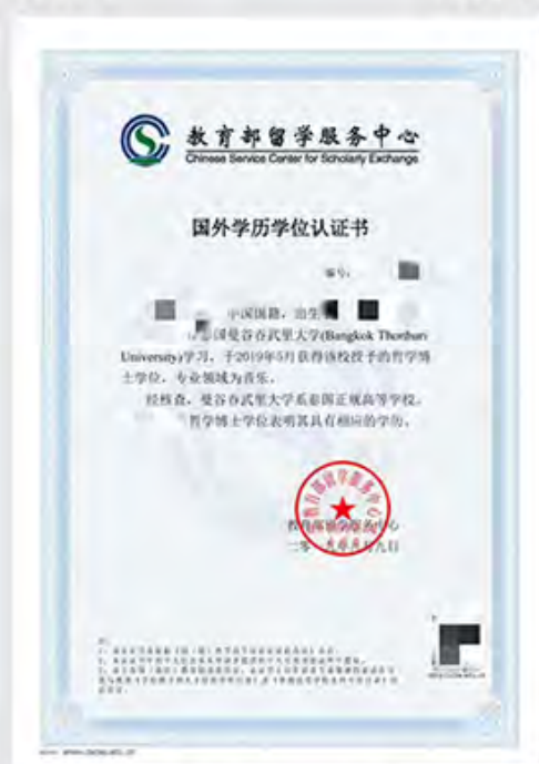
博士学位学历认证