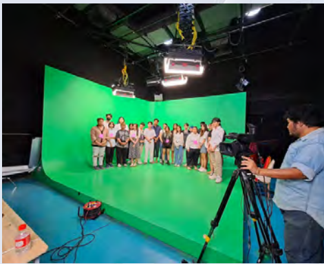
TELEVISION CHANNEL 电视频道