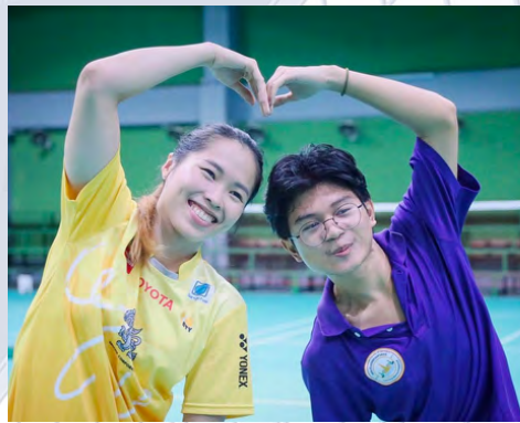
BADMINTON HALL 羽毛球馆