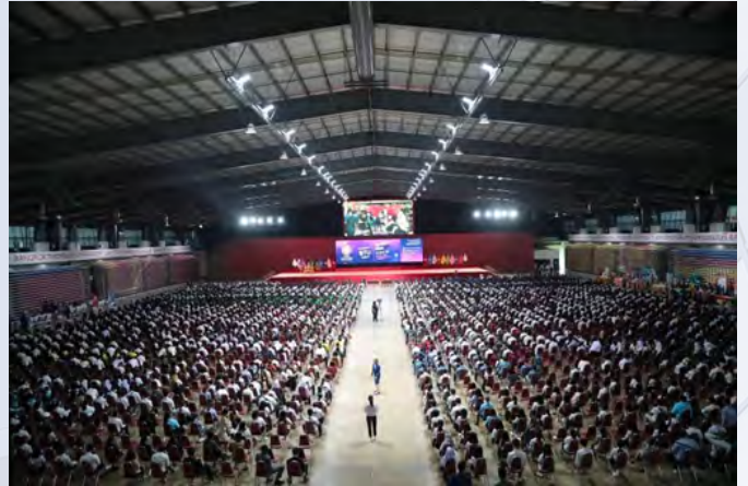
INDOOR COMPLEX HALL 室内综合体育馆